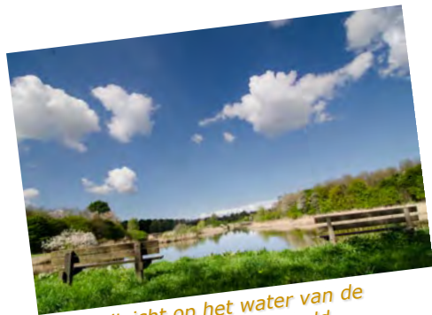
Riant uitzicht op het water van de Stille Vallei in het Horsterwold.

Het Pieper-rondje Zeewolde speelt zich af in de uitgestrekte polders en de aantrekkelijke loofbossen tussen Almere en Zeewolde. Het zijn niet alleen de akkers vol frisgroen aardappelloof en wuivend graan die een rol spelen, maar ook het Eemmeer, gezellige zandstrandjes en de heerlijke, schaduwrijke en windwerende loofbossen van het Hulkesteinse Bos en het Horsterwold. Daar kan de fietser picknicken in het bos, want in de polder doet men niet aan picknicktafels en -banken.