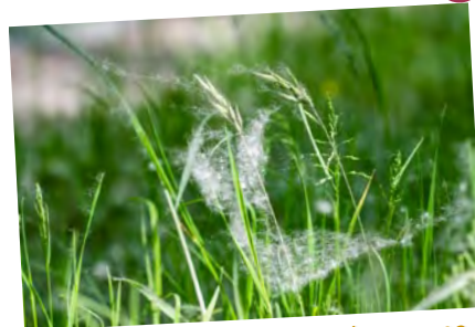
De witte pluïsjes – het zaad – van populieren lijkt op sneeuw in de zomer.