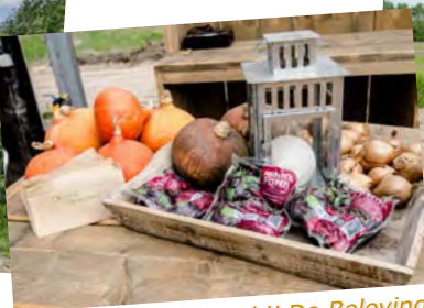
John's Farm-bieten bij De Beleving.