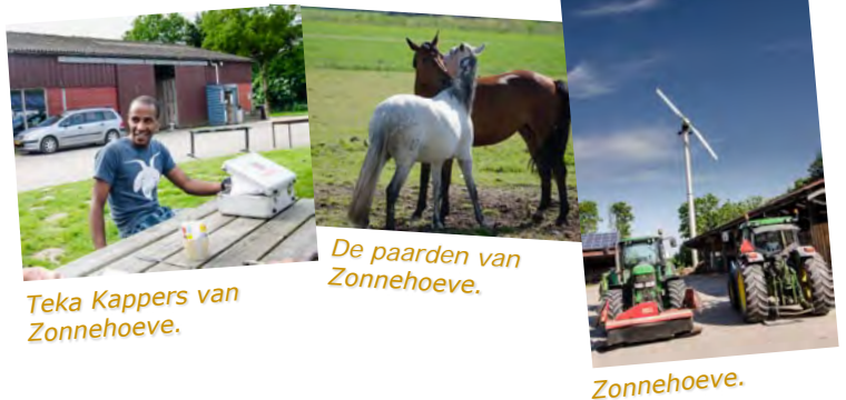
Teka Kappers van Zonnehoeve.

Kortom, Zonnehoeve is een bedrijf vol moderne ambities, waar je als fietser een kijkje kunt nemen, melk kunt tappen uit de melktap en – heel ouderwets – bij voldoende aanbod groente kunt kopen bij een stalletje aan de weg.