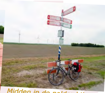
Midden in de polder bij knooppunt 36.