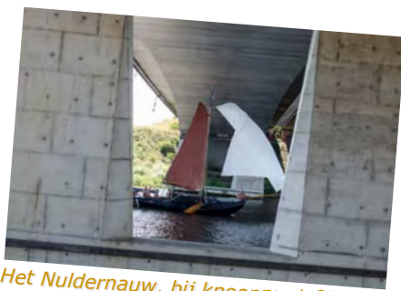
Het Nulder nauw, bij knooppunt 66.